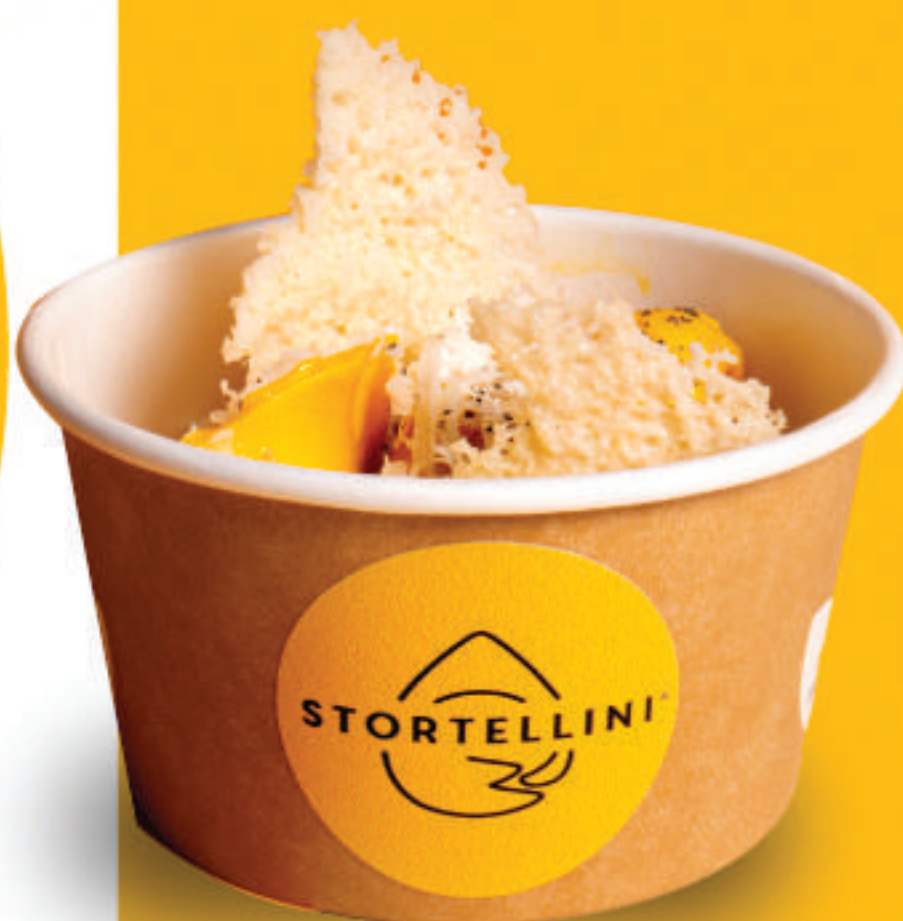
Alla Carbonara con condimento all'uovo