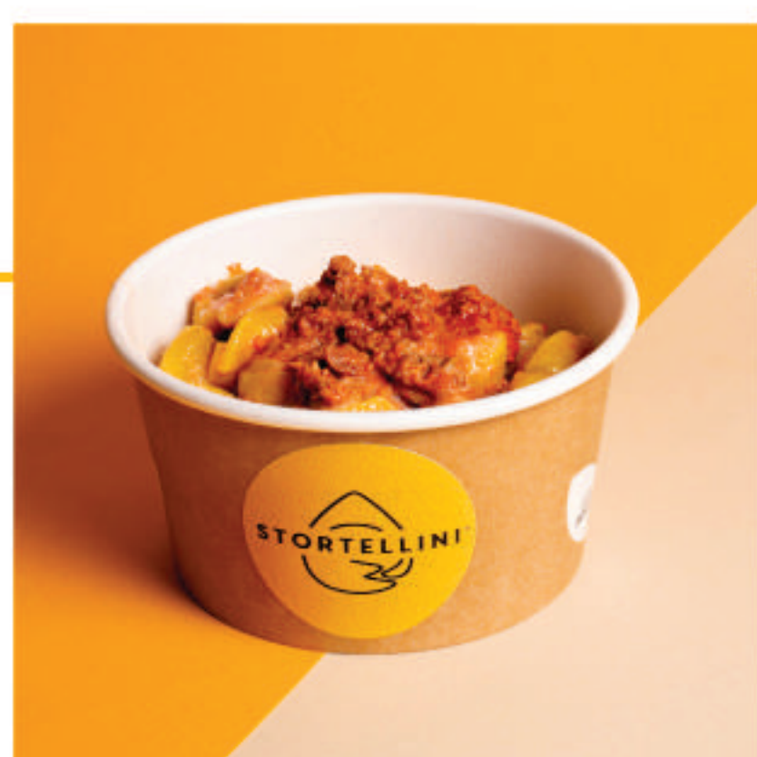
Al Ragù di carne