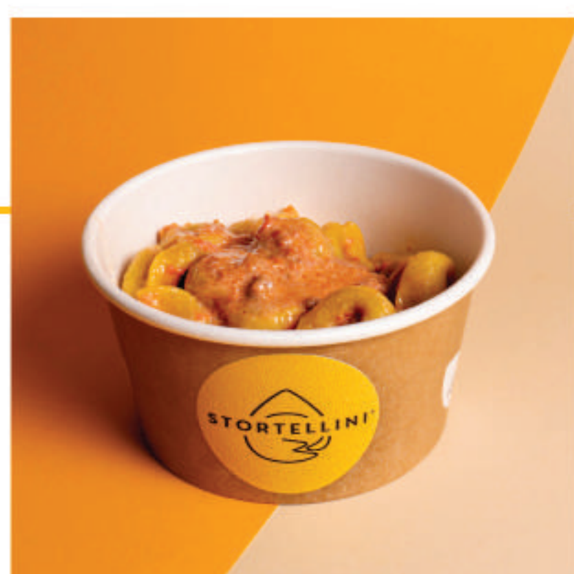
Pasticciati ragù e panna