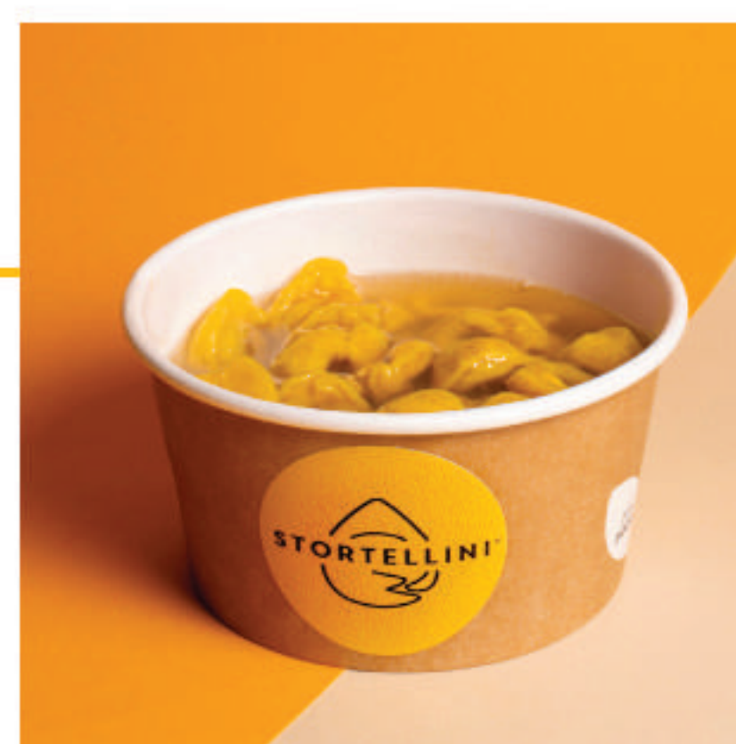
In Brodo di carne