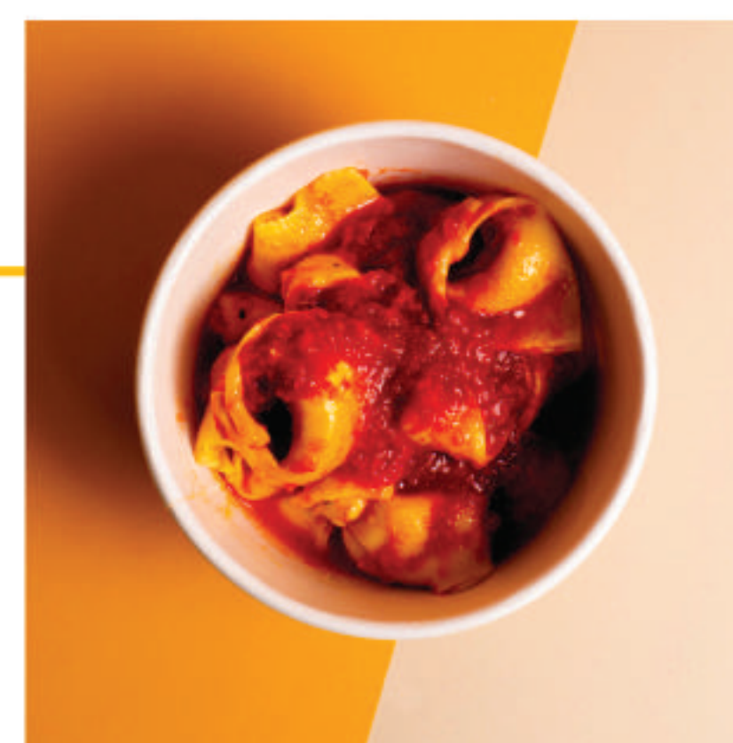
Al Sugo di Pomodoro