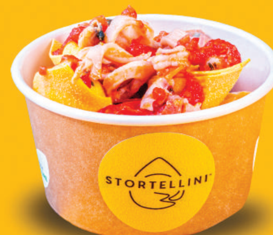
Al Pesce con sugo di pesce