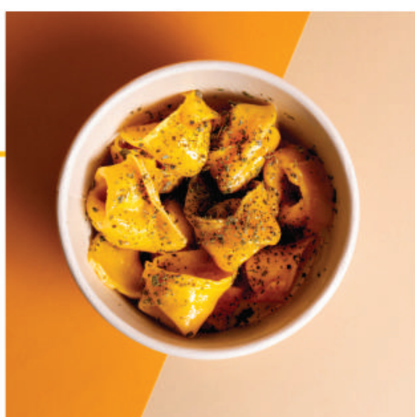
Burro e salvia

Con ripieno al formaggio o formaggio e spinaci