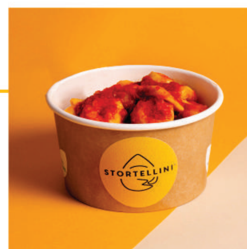
Al Sugo di Pomodoro